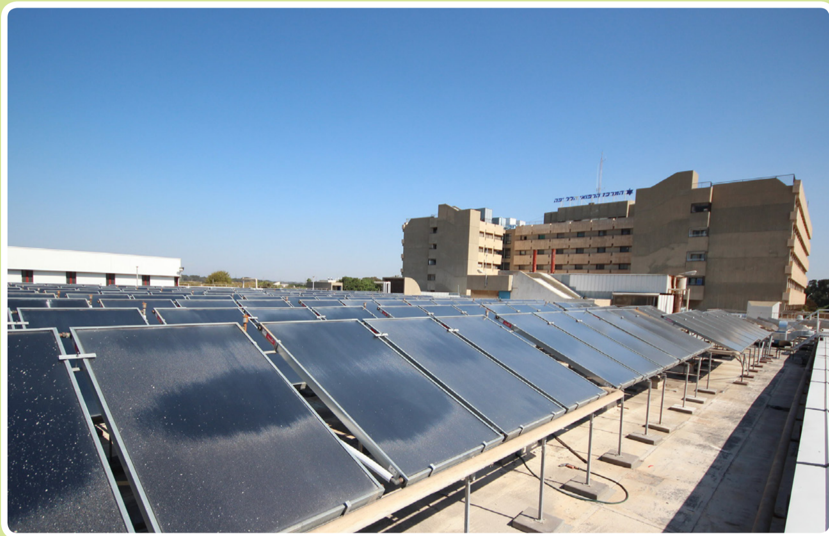
בתמונה: מערכת אנרגיה סולארית