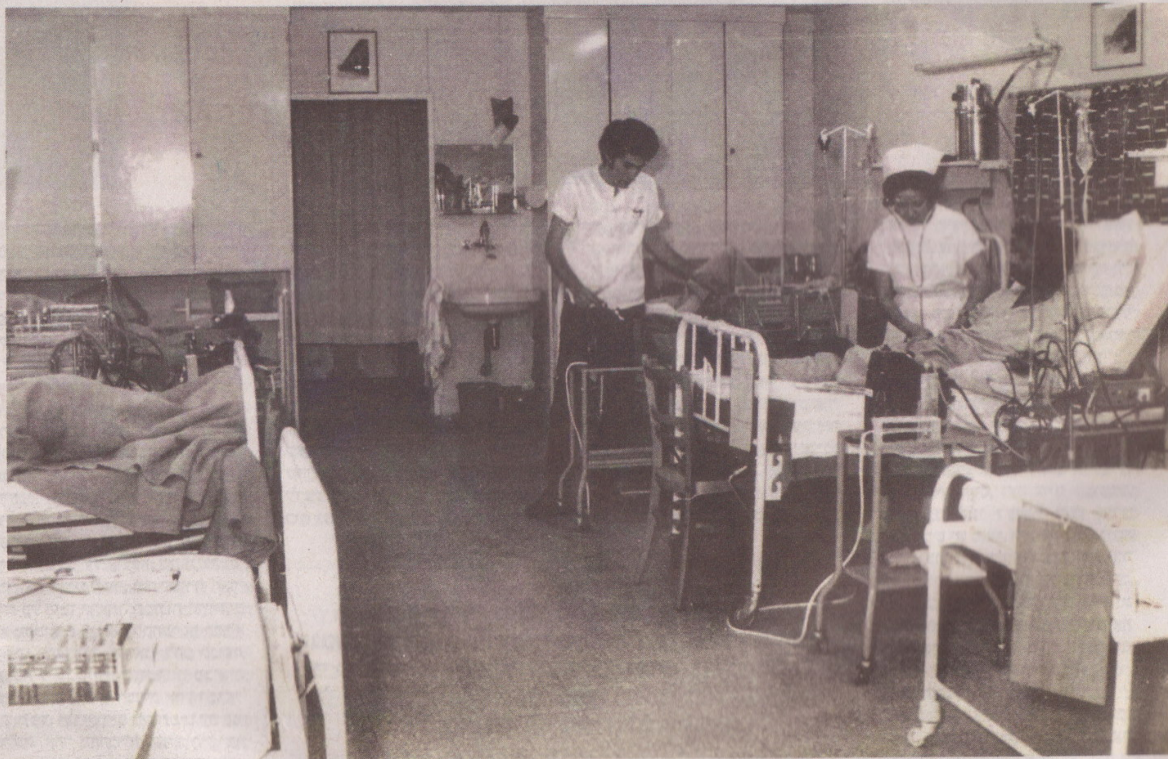
המחלקה לכליה מלאכותית ביום פתיחתה

בשנת 1957 הוחלט על הקמת בית חולים בחדרה. הקמת בית החולים היתה חלק מחזונו של ד"ר חיים שיבא ז"ל, המנכ"ל השני של משרד הבריאות, ומהאבות המייסדים של מערכת הבריאות בישראל. הוא ראה כצו השעה את פריסת בתי חולים ברחבי הארץ, לצורך כי אשפוז ומרפא לאוכלוסייה ההולכת וגדלה. הבחירה בחדרה היתה, למעשה, סיומו של מאבק איתנים בין העיר לבין שכנתה נתניה, על בניית בית חולים בשטחה, הן כמענה לצורך רפואי קהילתי, הן כמענה לפיתוח חשוב, המספק תעסוקה ופרנסה לאנשי האיזור.