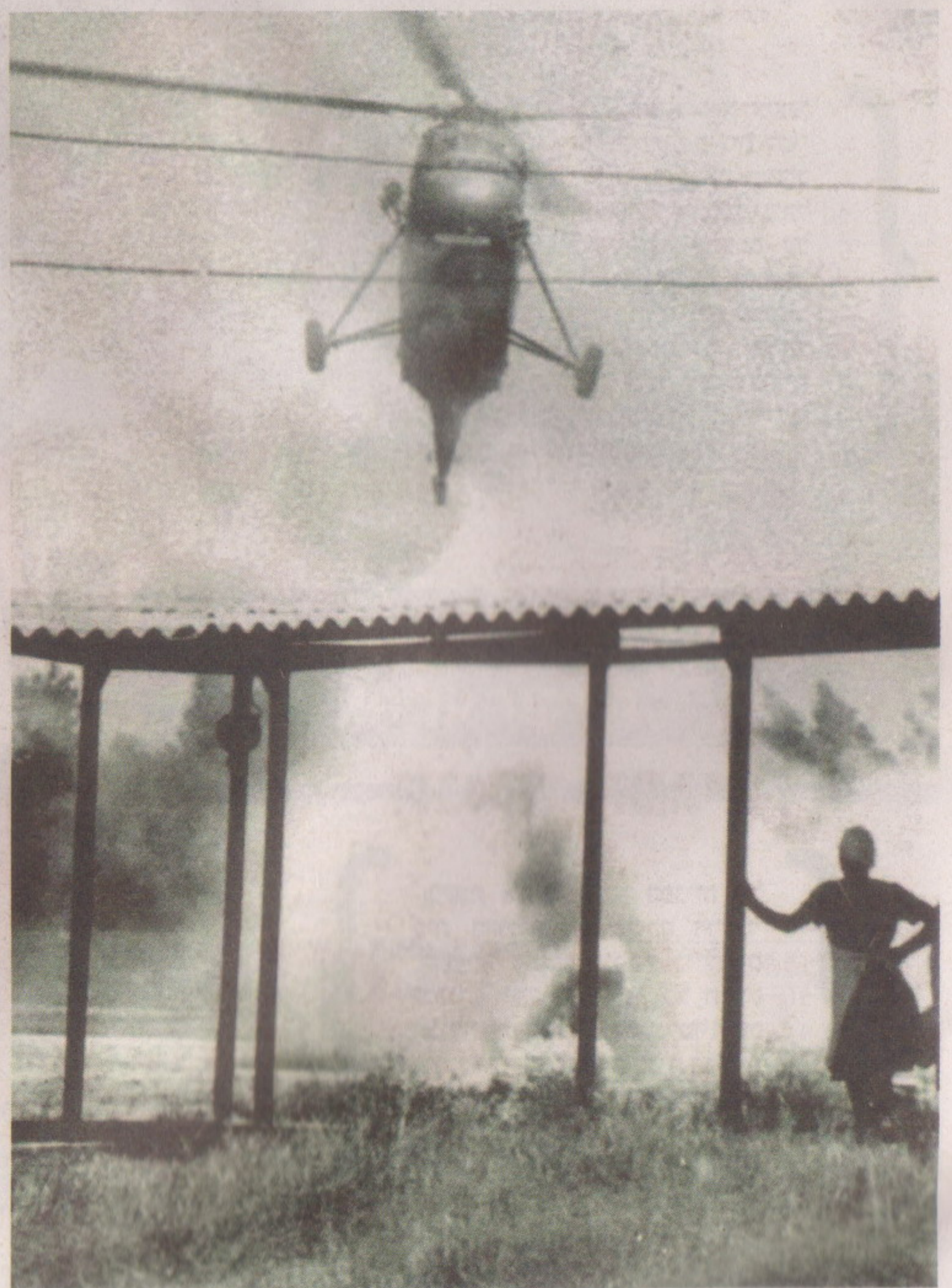
אחיות ממתיונות למסוק שהטיס פצועים מהחזית

בתקופת ההמתנה המתוחה נערך בית החולים לים למלחמה רבת-נפגעים. בכל המחלקות התבצעו הכנות מתאימות והוקצו מיטות. נוסף על המיון הרגיל, הוקם גם מיון ארעי באוהל גדול-מימדים. בסופו של דבר המל"חמה ארכה שישה ימים, ולבית החולים הופנו רק פצועים ספורים מחזית יהודה ושומרון.