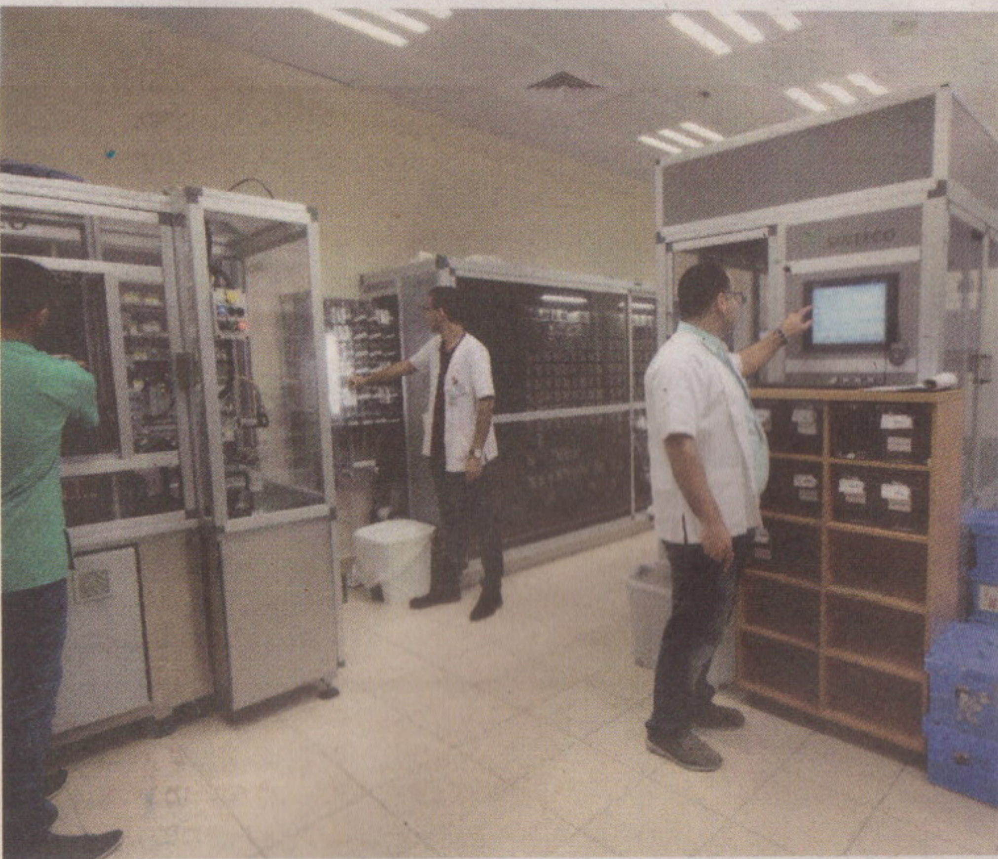
החדר שבו ממוקם הרובוט. מאחורי ארונות הזכוכית - התרופות