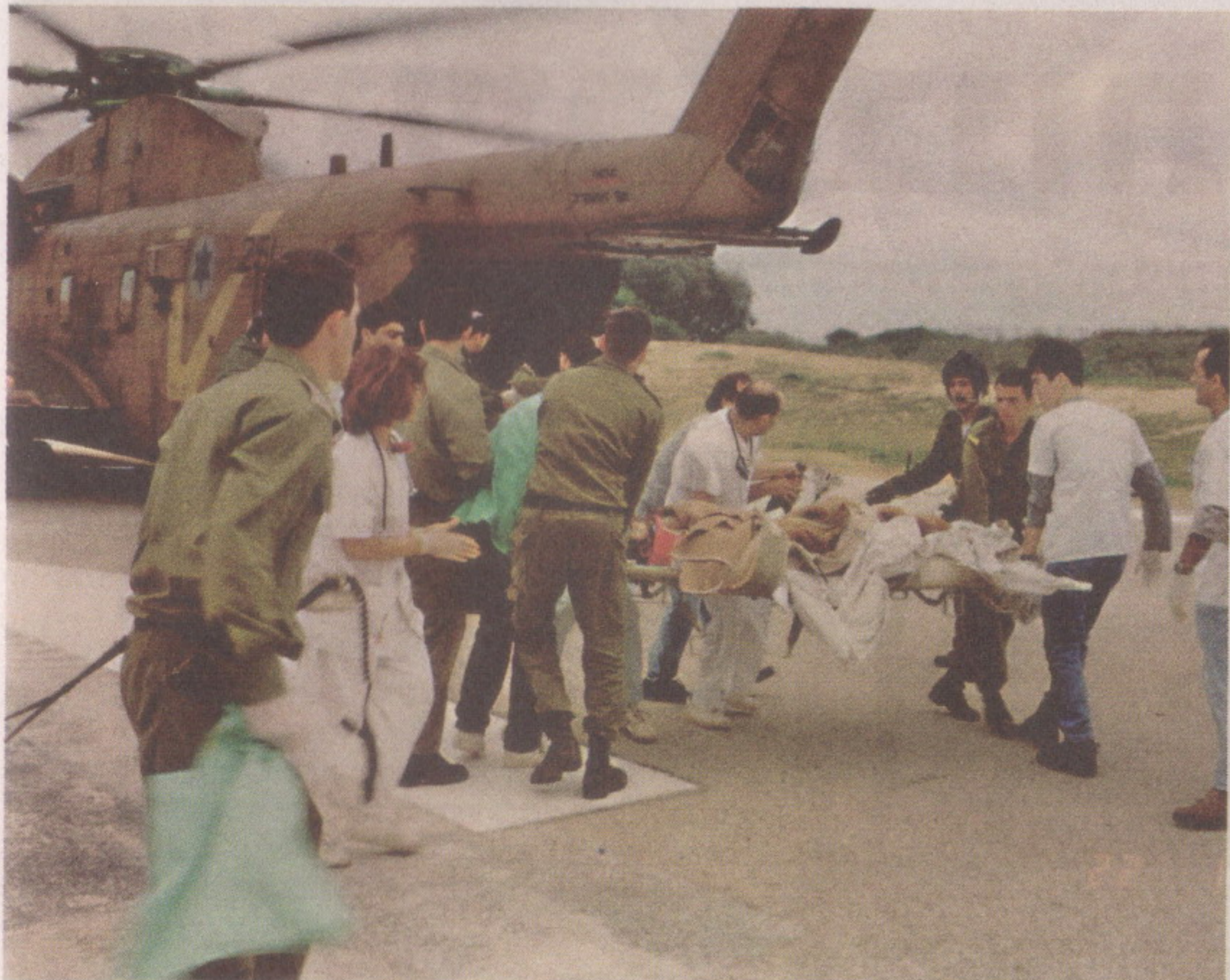
פינוי פצוע מהפיגוע בבית ליד

ב-22/1/1995 החרידו פיצוצים עזים את צומת בית ליד, ששימש מקום מפגש הומה לחיילים במשך כל השבוע. מדובר היה בשני פיגועי התאבדות זה אחר זה. באירוע הנורא נהרגו 21 איש, רובם חיילי צה"ל. עשרות מהפצועים זרמו אל בית החולים, שרק שנה לפני כן הוכרזו כמרכז טראומה אזורי. בבית החולים זוכרים את היום הזה כאחד הקשים ביותר שידע המוסד הרפואי. האירוע הזה גם מיסד תפיסת טיפול אחרת למיון פינוי של פצועים באירוע רב-נפגעים, כך שחלק מהפצועים עזבו מטרופלים כהלל יפה וחלק מועברים באופן מיידי לטיפול בבתי חולים אחרים, בהתאם לחומרת הפגיעה.