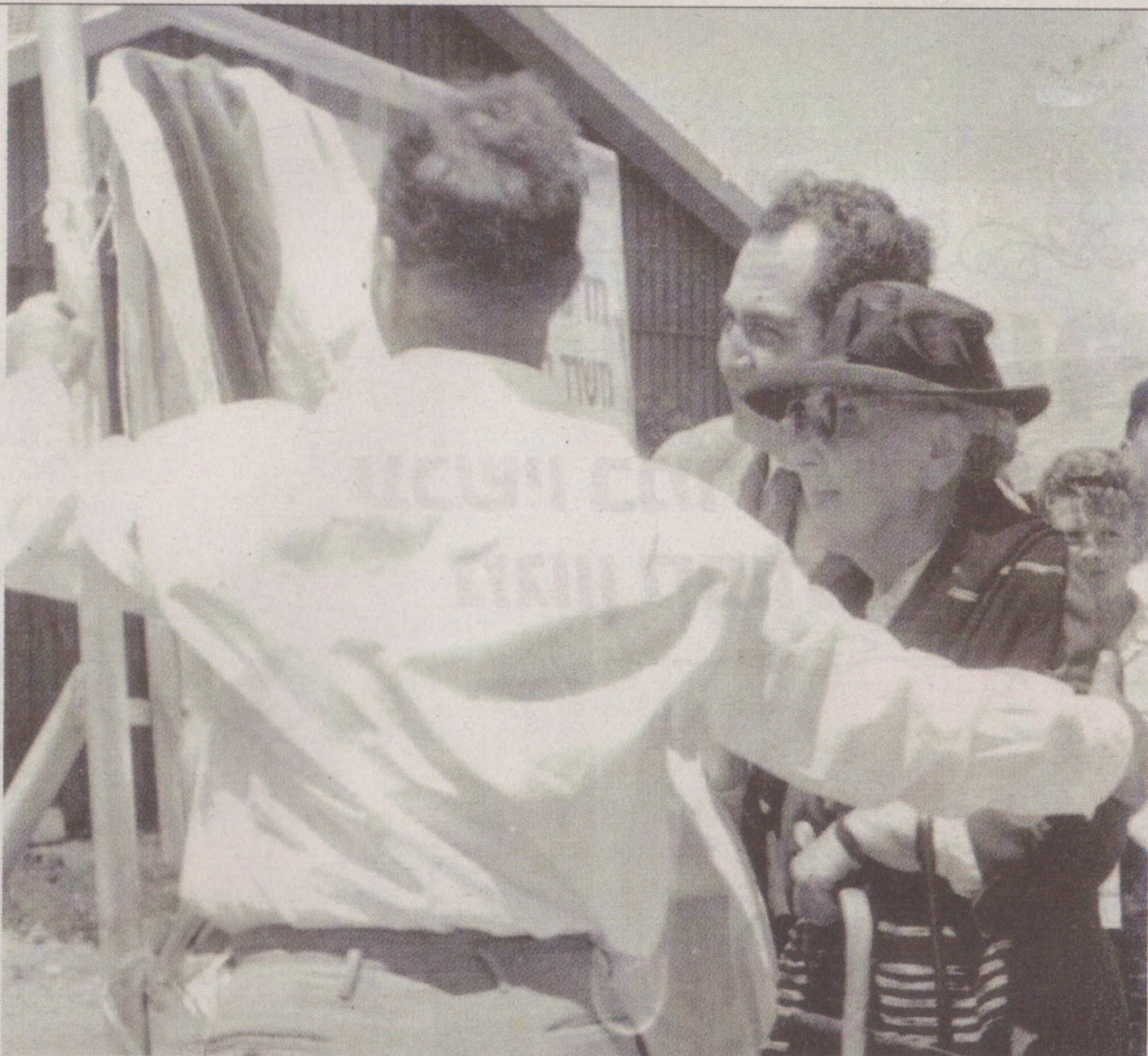
אלמנתו של ד"ר הלל יפה בטקס החנוכה הרשמי