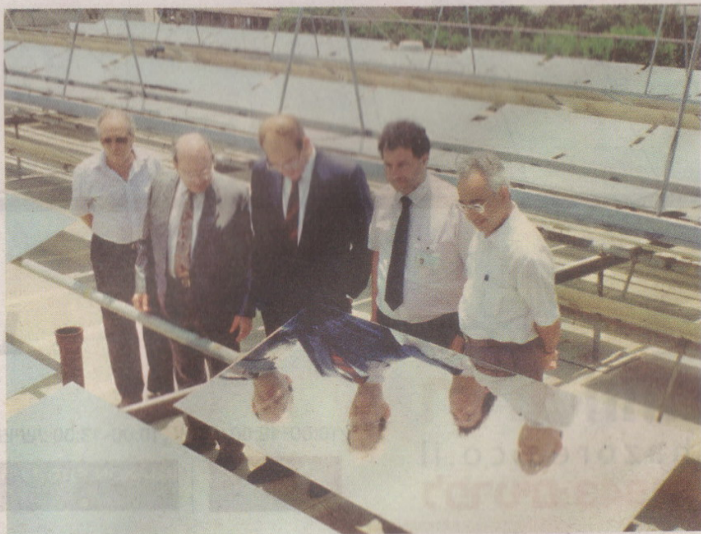
טקס חנוכת המערכת בנוכחות שר האנרגיה דאז, אהוד אולמרט.

קשיי התקציב גרמו לבית החולים לחפש דרכים יצירתיות ליעילות ולחיסכון, תוך שמירה על משאבי הטבע. ברוח זו נחנך בשנת 1990 מתקן אנרגיה סולארית - חווה ענקית של קול"סי שמש, שהוקמה על ידי חברת האנרגיה "פז" ונועדה לספק לבית החולים אנרגיה בהזלה ניכרת. מדובר במהלך שהקדים את זמנו, וגם כיום נחשב עדיין למהפכני בקרב מוסדות ממשלתיים. בית החולים הלל יפה קיבל לפני שנים ספורות תן תקן "ירוק" ממכון התקנים, וממשיך לפעול בדרך הזו.