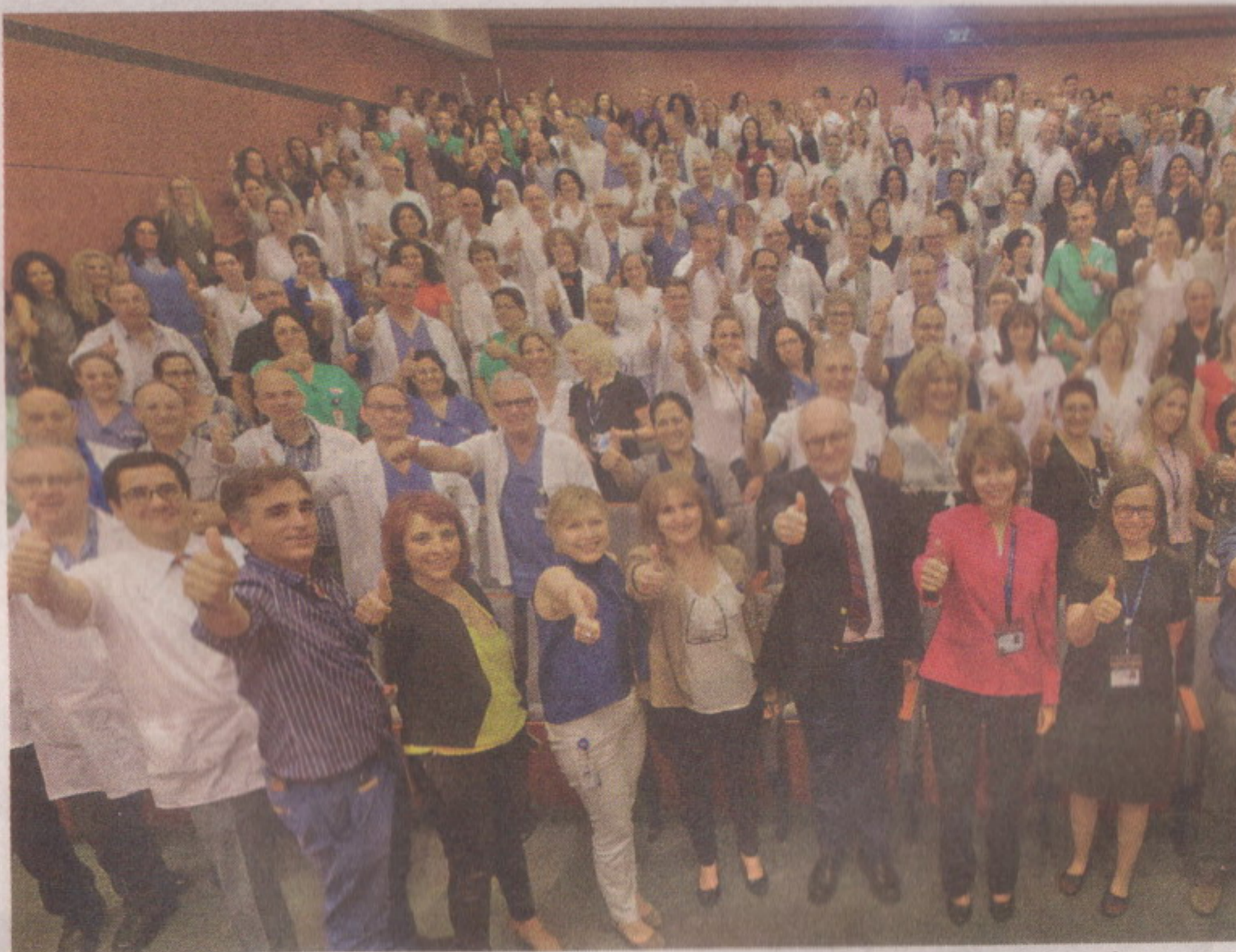
מעמד קבלת תו התקן, סגל בית החולים מרים אצבע להצטיינות

ביוני 2017, אחרי תהליך ארוך ושנים של עבודת מאומצת, זכה המרכז הרפואי הלל יפה להסמכה, באמצעות קבלת תו התקן הבין-לאומי מטעם ארגון ה-JCI - תקן איכות ובטיחות ברפואה, מהמחמירים ביותר הקיימים לבתי חולים בעולם. התקן התקבל לאחר בחינה מדוקדקת על ידי נציגי הארגון. הם הגיעו מארצות הברית, וברקו במהלך כמעט שבוע כל פינה וכל תחום בבית החולים: נוהלי עבודה, תהליכי עבודה, תיקים רפואיים ותיקי עובדים, בקרת זיהומים, אחזקת מכשור רפואי, רצפות, קירות, שי" לוט ועוד. על פי דיווחי משרד הבריאות, הלל יפה היה בית החולים שעבר את הסקירה בציון הגבוה ביותר, ועם מספר מינימלי של הערות מהסוקרים.