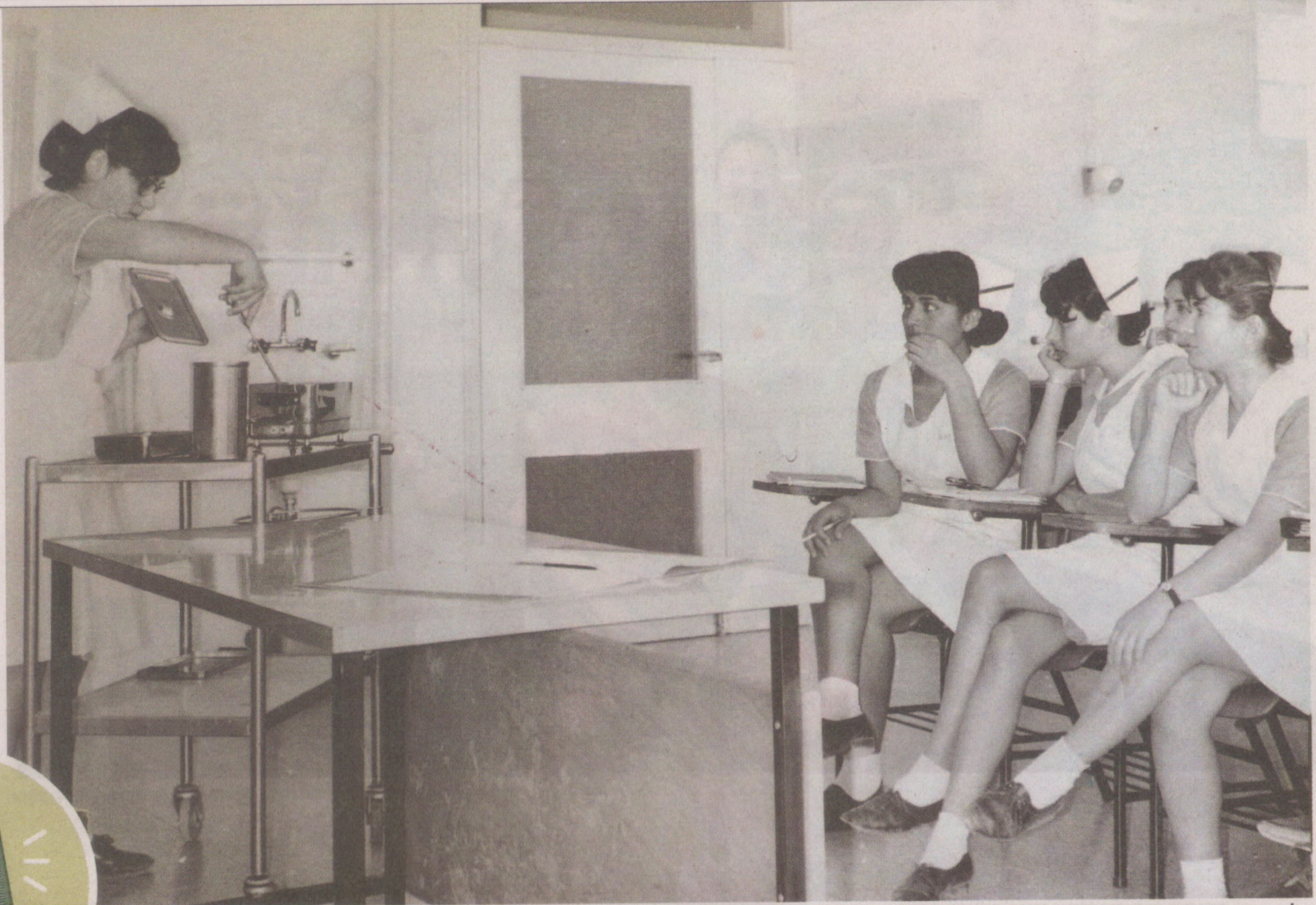
תלמידות בעת שיעור בבית הספר עם פתיחתו