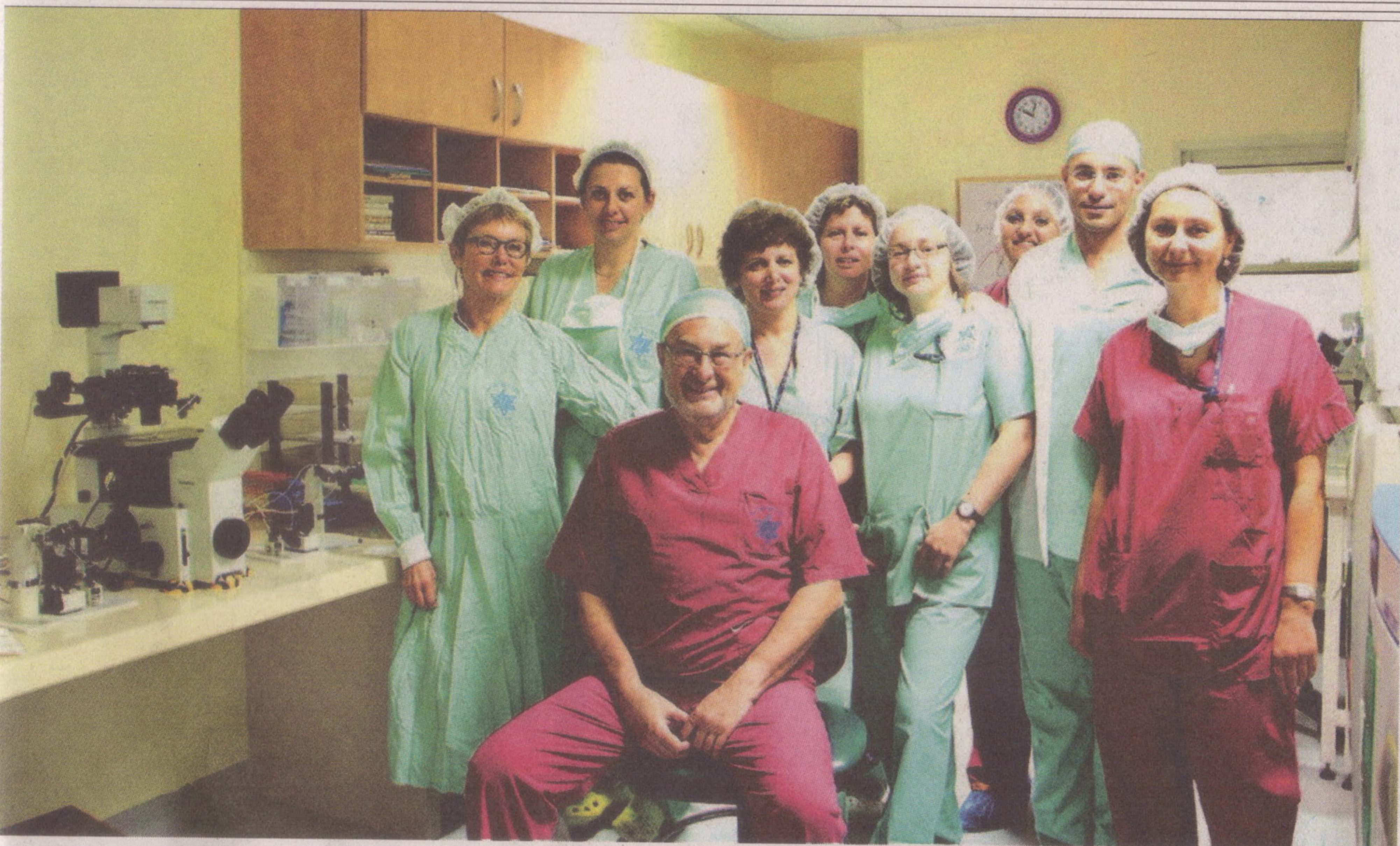
צוות היחידה להפרייה חוץ-גופית שהיה שותף לתהליך בשנת 2012